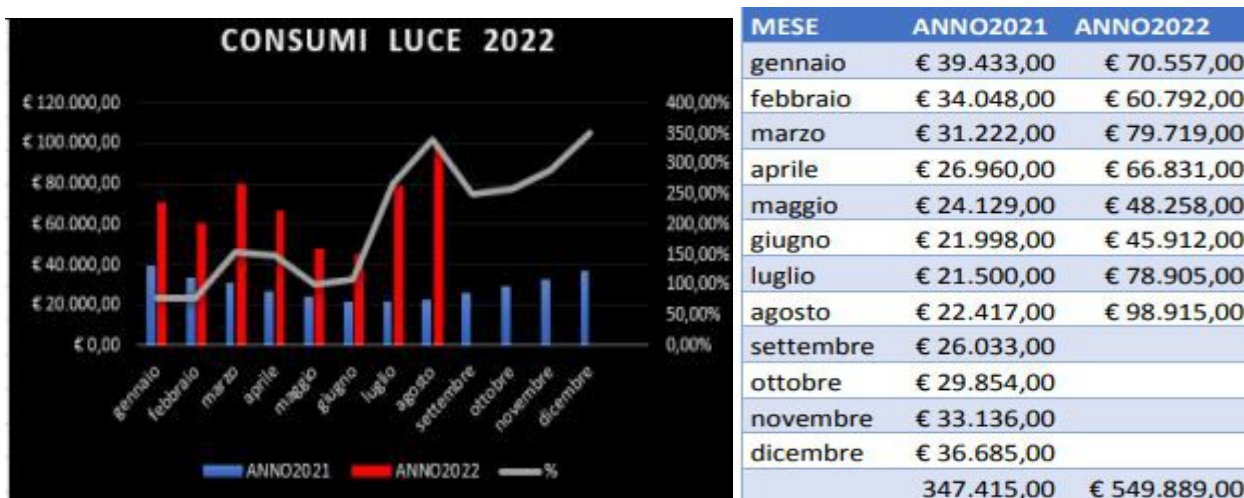
TABELLA 1-2: Costi sostenuti fino ad Agosto 2022 per energia elettrica