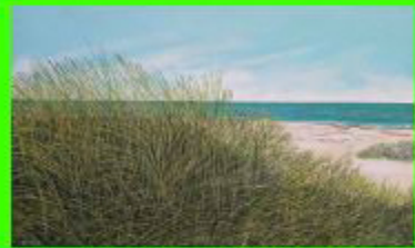
DUNE CON CESPUGLIA LIDO DI DANTE - RAVENNA

INAUGURAZIONE: SABATO 12 MARZO 2022 ORE 17.00