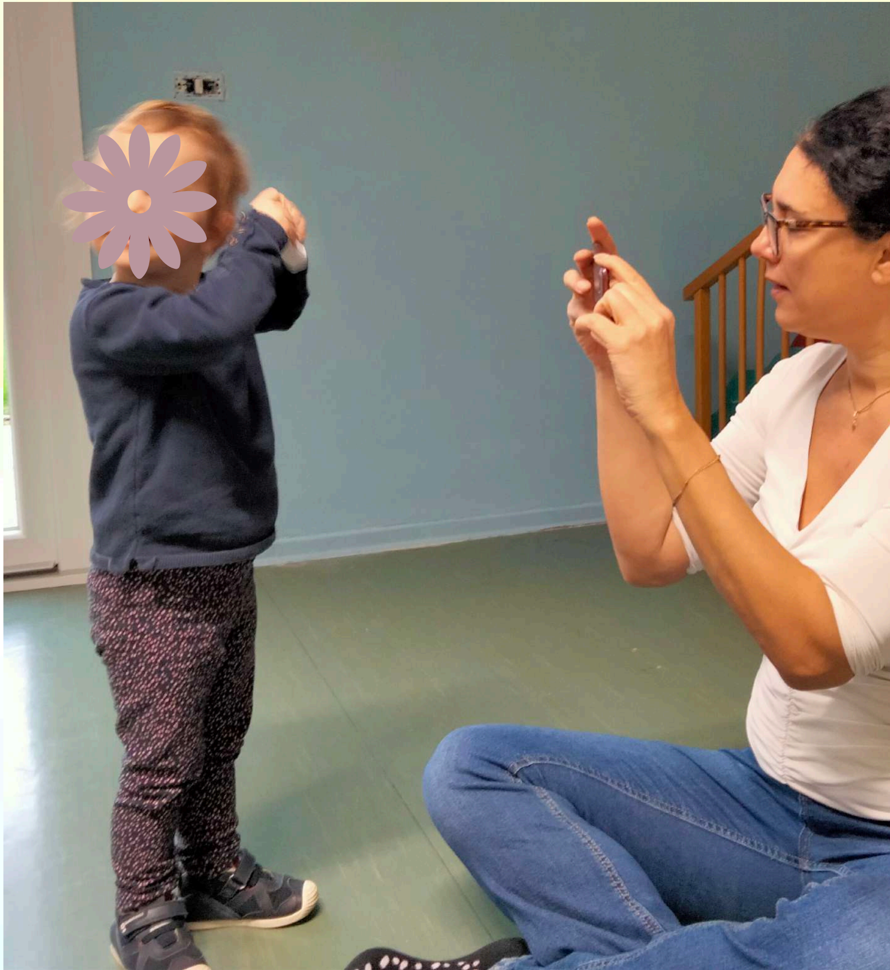
Ascoltare piccoli rumori e oggetti sonori

Consolidare le capacità di riconoscere le emozioni e sviluppare l'empatia: ascoltare, ascoltarsi ed essere ascoltato.