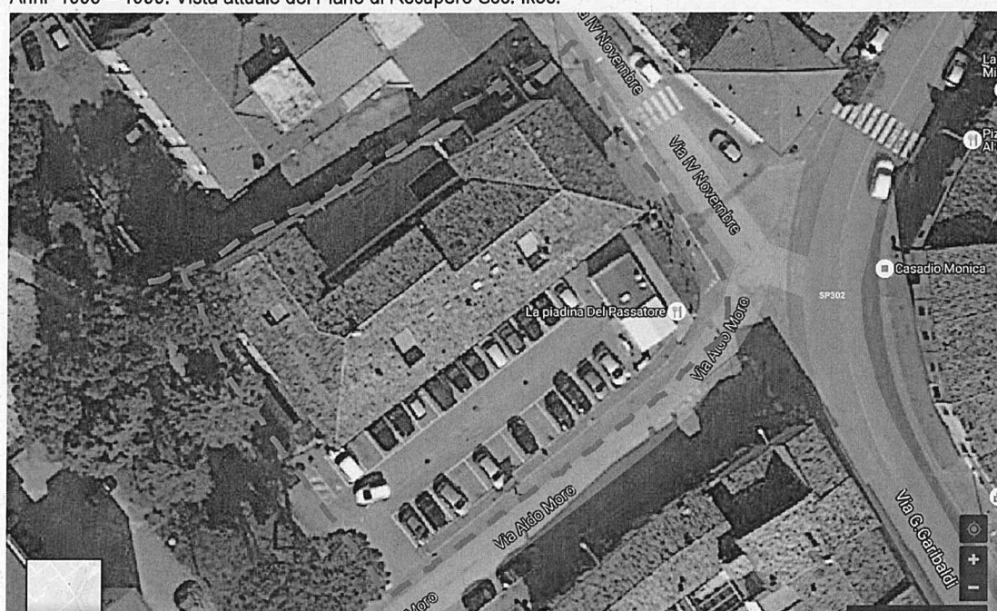
Anni 1995 – 1999. Vista attuale del Piano di Recupero Soc. Ikos.