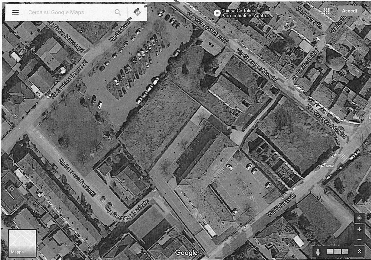
Anni 2000 – 2004. Vista attuale del Piano di Recupero Soc. Il Centro.